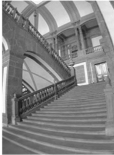
La gran escalera del Palacio de Minería.