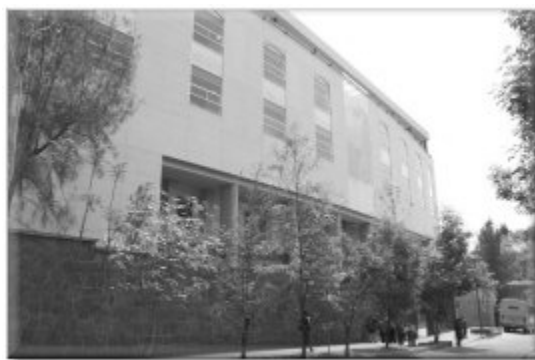
Instituto Tecnológico Autónomo de México.