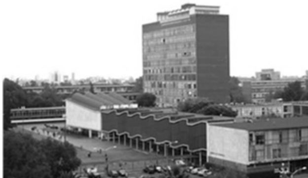
La exfacultad de Ciencias en CU.

gran cantidad de actividades para darle un fuerte impulso a las matemáticas en nuestro país, entre las que destacan la organización de la segunda serie del Boletín de la Sociedad Matemática Mexicana y dos eventos más que colocaron a México en el mapa internacional de las matemáticas: en 1956, se realizó el Symposium Internacional de Topología Algebraica y, en 1959, el Symposium Internacional de Ecuaciones Diferenciales.