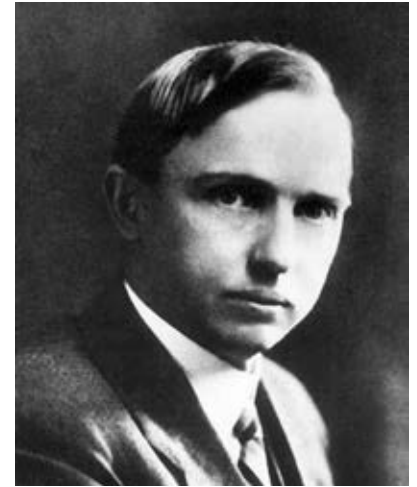
Harlow Shapley (1885-1972)