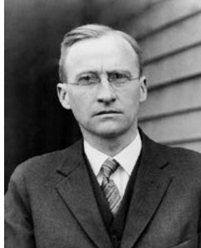
George David Birkhoff (1884-1944)