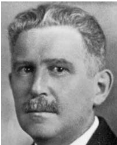
Solomon Lefschetz (1884-1972)