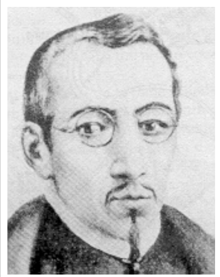
Carlos de Sigüenza y Góngora.

Como cosmógrafo real de la Nueva España trazó mapas hidrológicos del Valle de México. En 1693 fue enviado por el virrey como acompañante del almirante Andrés de Pez en un viaje de exploración al norte del Golfo de México y